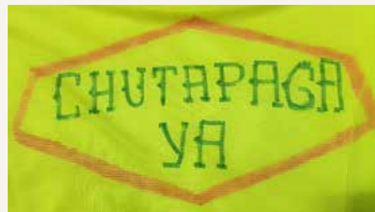
Acervo gráfico de los extrabajadores de Cervecería Nacional.

→ PUBLICIDAD de la Cerveza Artesanal que se produjo como parte de la campaña #ChutaPaga.