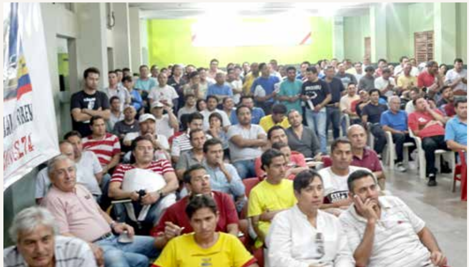
(retocada con Inteligencia Artificial)