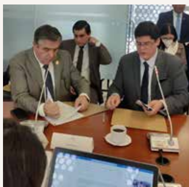
↑ MINISTRO Y VICEMINISTRO de Trabajo pasando apuros en la Comisión de Régimen Económico.

“Nosotros denunciábamos esto como parte de la estrategia, porque se trataba de seguridad nacional y porque sabíamos que, a través de estos mecanismos, podían ser observados y llamados los ministros de Trabajo y de la Producción a la Asamblea Nacional, para que explicasen cómo es posible que el Estado o el Gobierno les estaba dando un beneficio tributario de más de 35 millones de dólares, sin pagar a