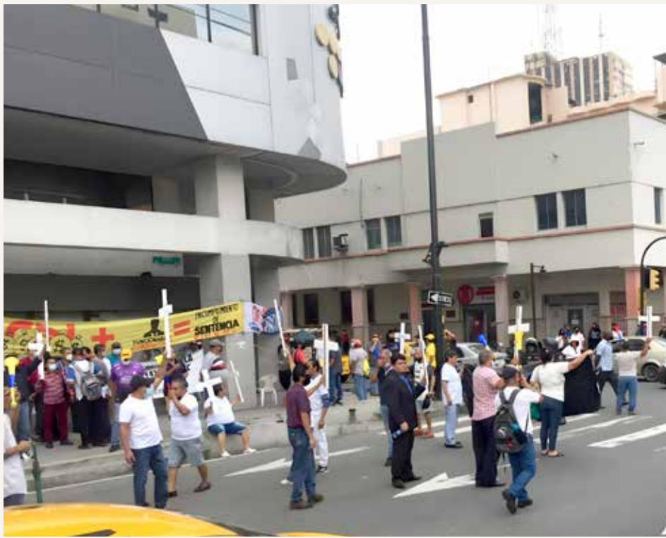
Acervo gráfico de los extrabajadores de Cervecería Nacional