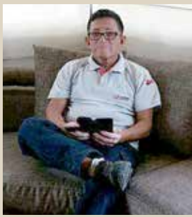
WILSON CRESPIN BODEGAS DE DESPACHO