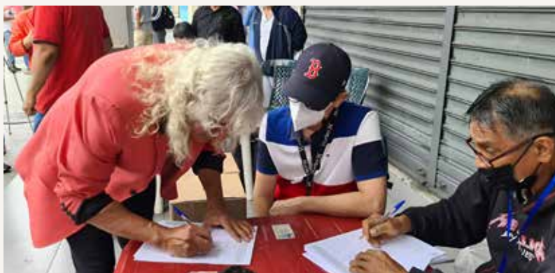
↑ LOS EXTRABAJADORES en la jornada de votación para elegir a sus procuradores comunes.