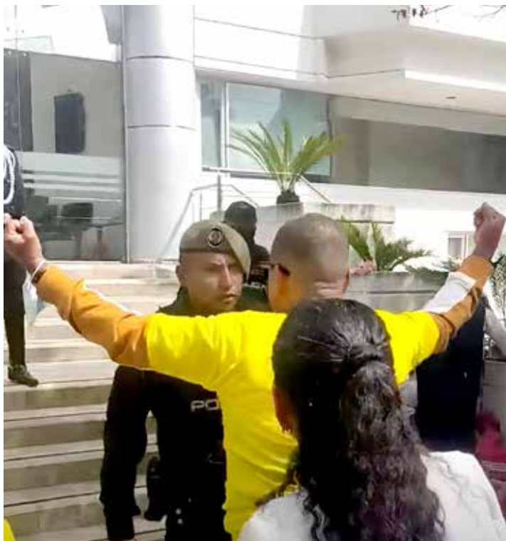
Acervo gráfico extrabajadores Cervecería Nacional