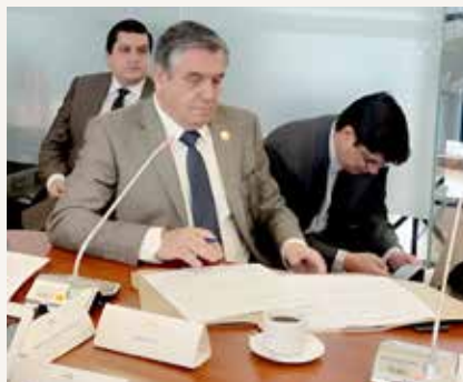
↑ EL MINISTRO DE TRABAJO , Patricio Donoso durante su comparecencia en la Comisión de Régimen Económico de la Asamblea Nacional.