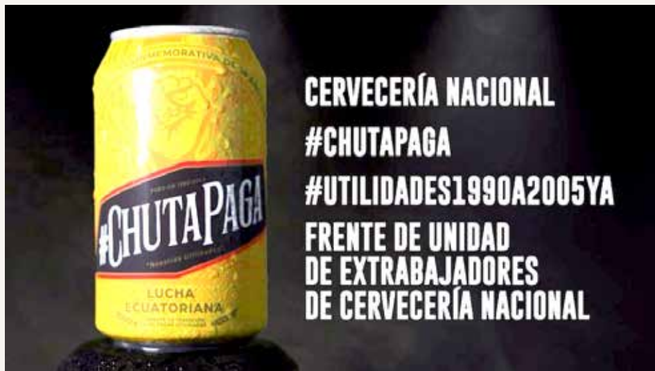
Equipo de Publicidad de la Campaña.