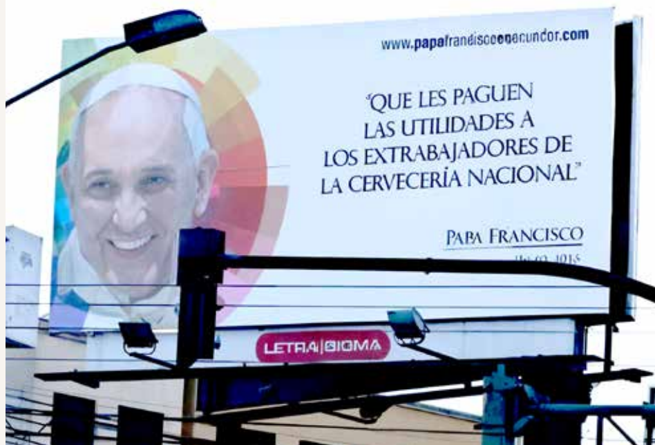
Diseño Bolívar García

El sábado 24 de agosto a media noche Segovia es desalojado nuevamente de manera violenta y por cuarta ocasión del parque El Arbolito por un operativo a cargo del Capitán de Policía Vargas Palacios, en conjunto la Po-