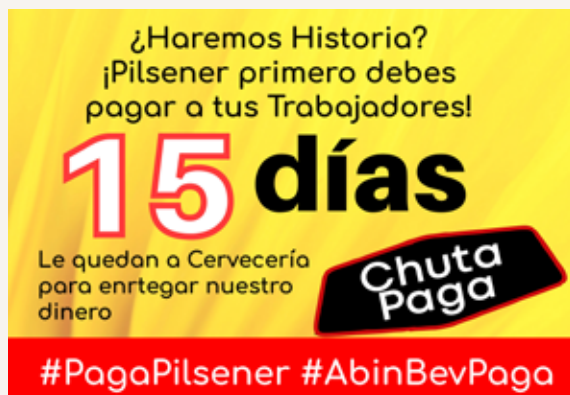
Diseño Felipe Ogaz Oviedo

→ CUENTA REGRESIVA para presionar a Cervecería Nacional por el pago.