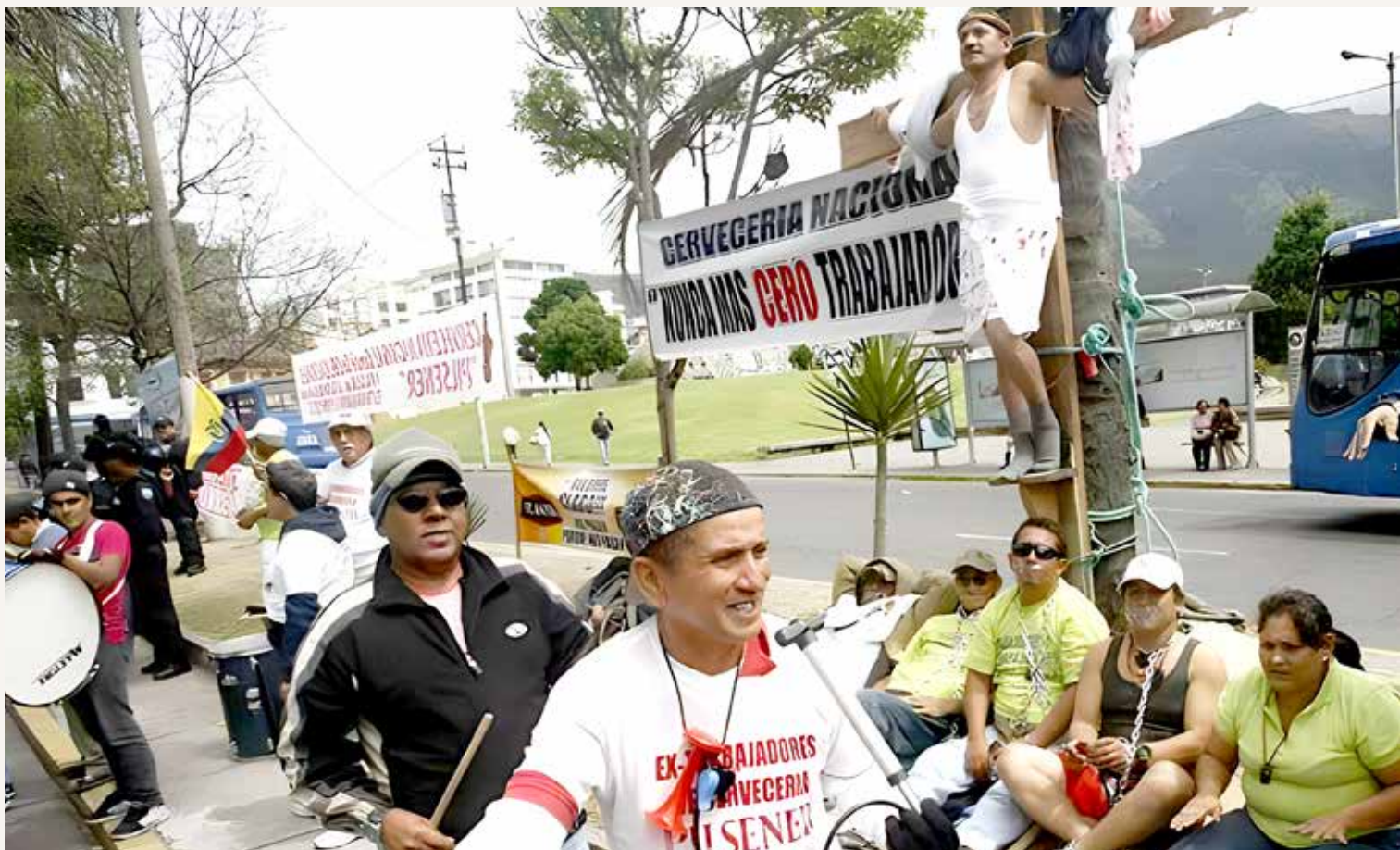
Acervo gráfico de los extrabajadores de Cervecería Nacional

En 2011, decenas de extrabajadores comenzaron una huelga de hambre frente a la Corte Constitucional en Quito. En esta protesta, el actual procurador común Gabriel Segovia se colgó de una cruz de madera en señal de protesta y otros extrabajadores le rodeaban con cadenas en el cuello. En respuesta un cordón policial se colocó ante la puerta de esa institución mientras aproximadamente 20 empleados con pitos, tambores y consignas detuvieron el tráfico para exigir ser escuchados.