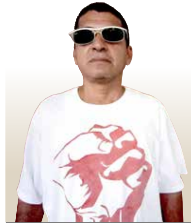
Acervo gráfico extrabajadores Cervecería Nacional

↓ PRIMER PLANO de un héroe de la clase obrera.